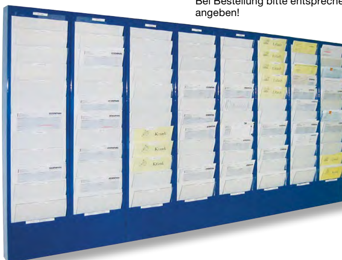
Anwendungsbeispiel: Auftragsorganisation für 8 Mitarbeiter mit Tageseinteilung über den Zeitraum von 2 Wochen.