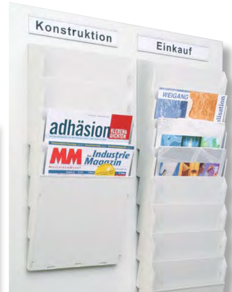
Abb. Griffsichten mit Spalteneinteilung nach Abteilungen