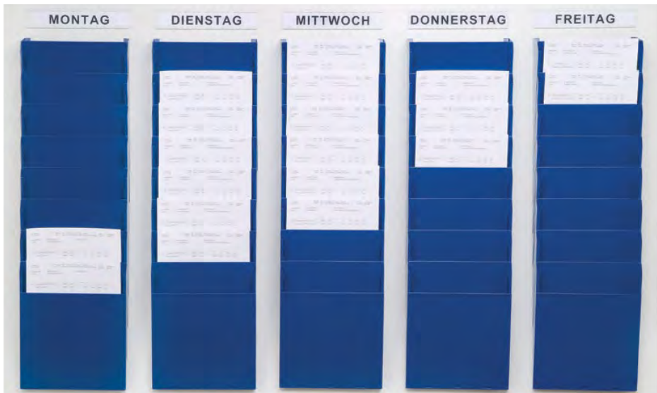
Abb. Griffsicht, Arbeitsverteilung der Woche