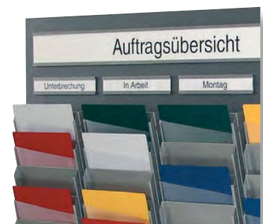
Abb. Griffsicht, Auftragsübersicht mit Statusanzeige