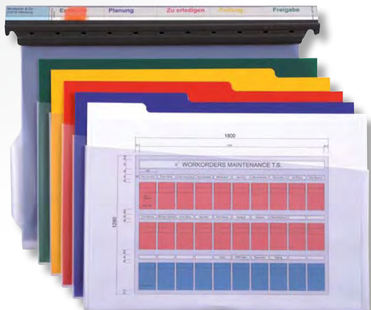
Die farbige Beschriftung der Skala korrespondiert mit den Farben der TabTaschen. Der Schrägschnitt an den TabTaschen gewährleistet einen schnellen Zugriff auf die lose Blattablage.

Ihre Idee... lassen Sie uns darüber reden!