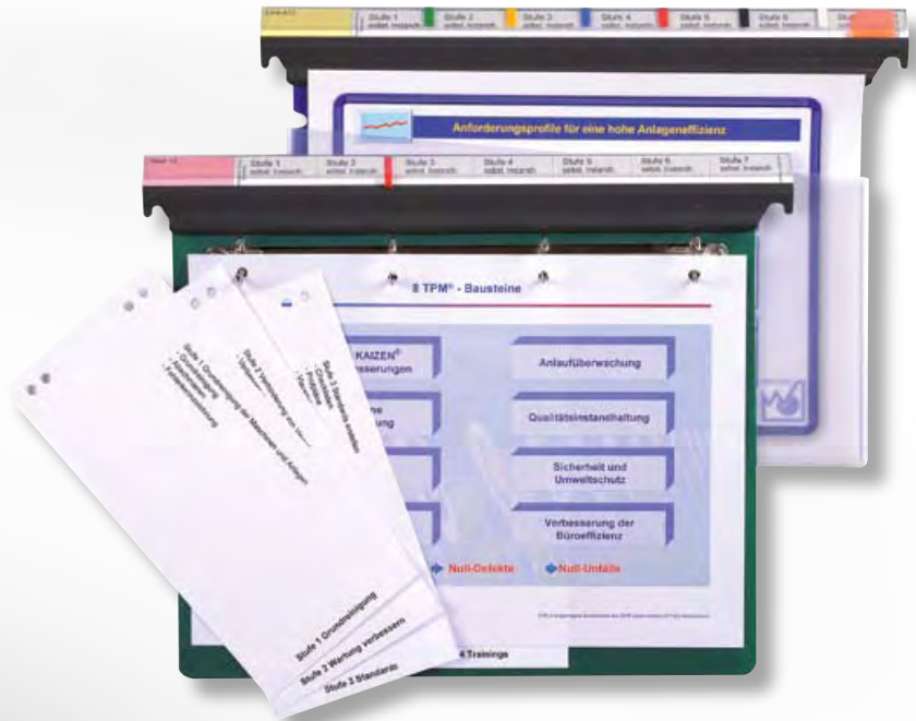
Tasche und Ringhefter mit Registerfahnen nehmen die Unterlagen der TPM-Aktion auf und visualisieren die erreichten Stufen.

Hier realisieren wir Kundenwünsche vom Prototyp bis zur Serienfertigung.