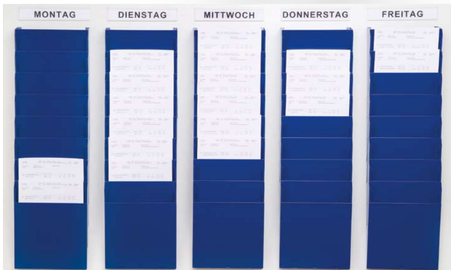
Abb. Griffsicht, Arbeitsverteilung der Woche