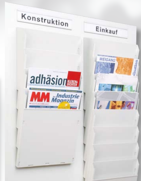
Abb. Griffsichten mit Spalteneinteilung nach Abteilungen