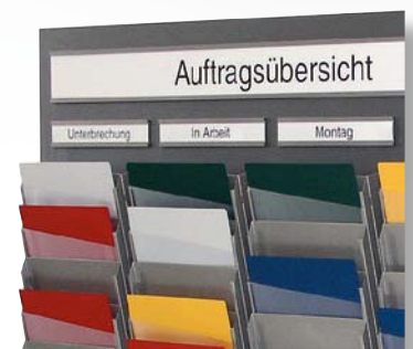
Abb. Griffsicht, Auftragsübersicht mit Statusanzeige